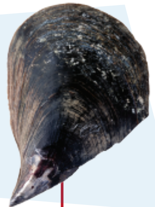
Moule géante (ō'ota)