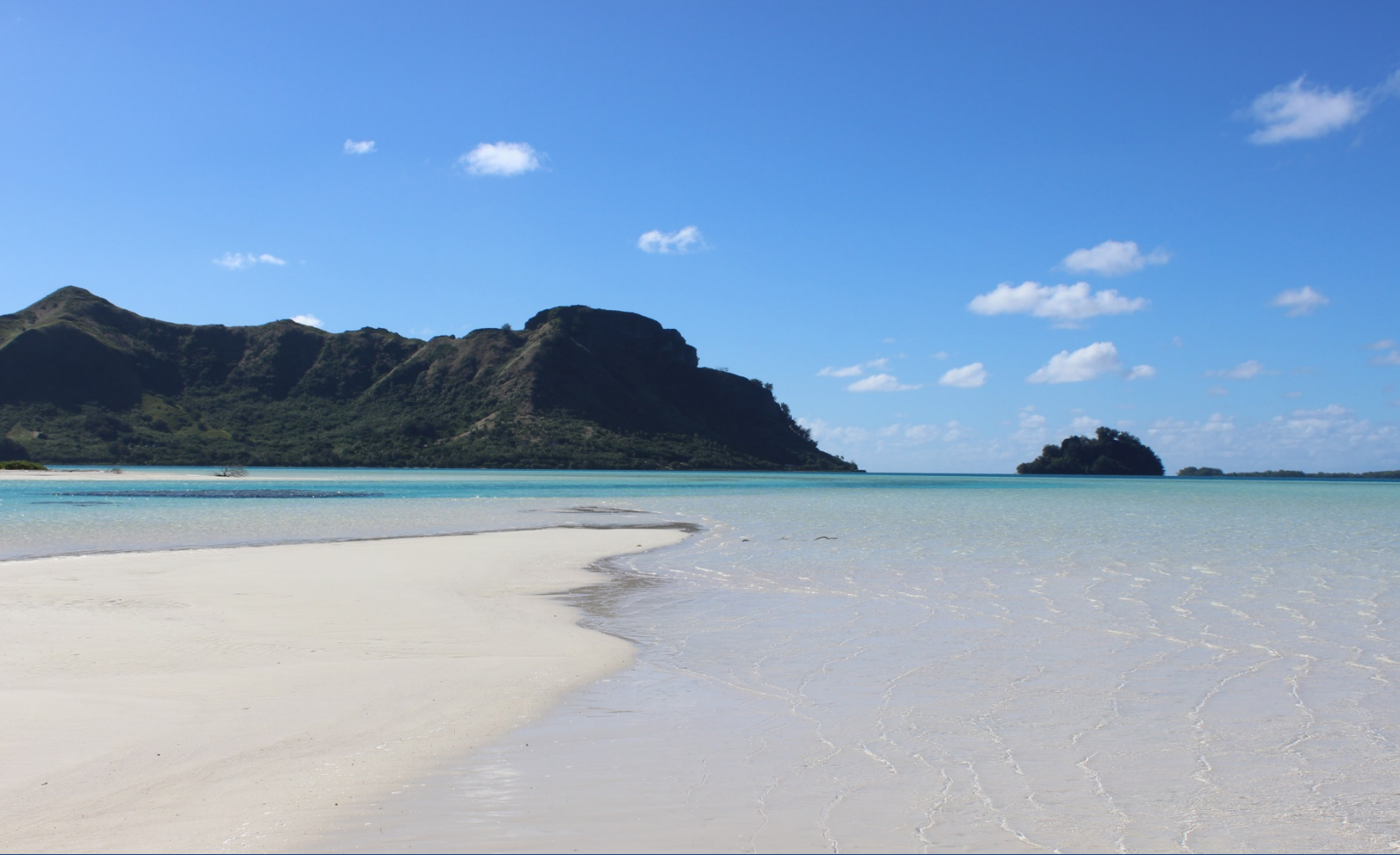
« Motu piscine » i Ra'ivavae – Donatien Tanret