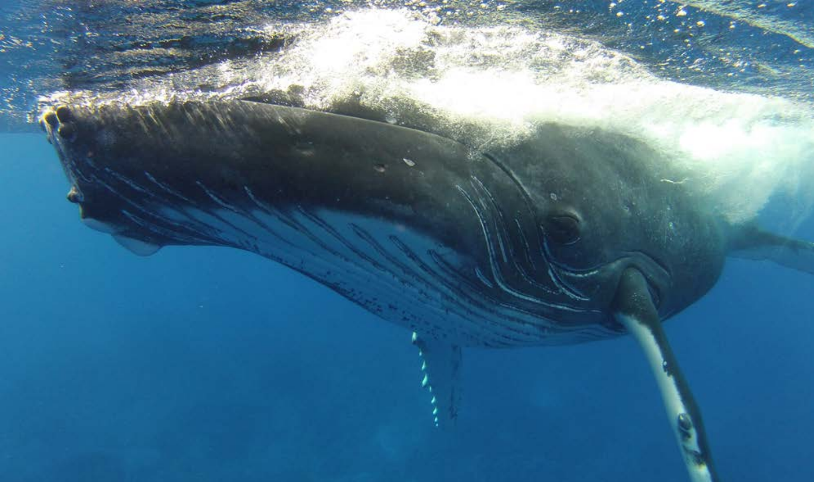
Te tohora i Rurutu – Agnès Benet