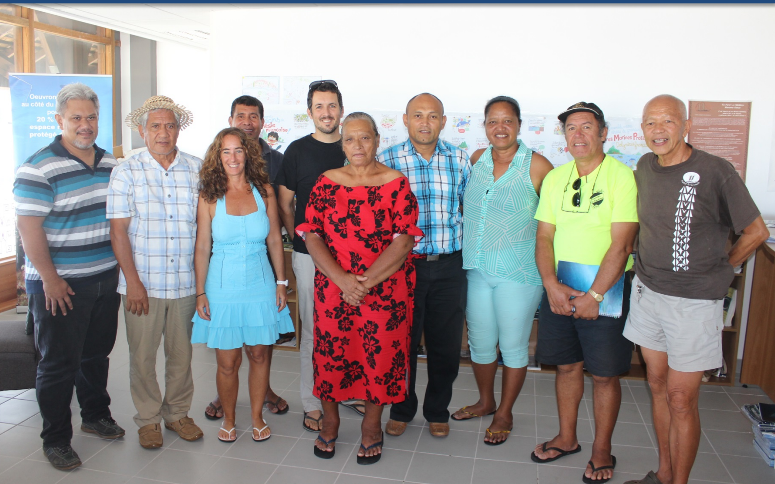
Putuputura'a o nā ti'a e rave rahi nō nā 'oire nō Rimatara, Rapa, Ra'ivavae, Rapa 'e Tupua'i – Donatien Tanret