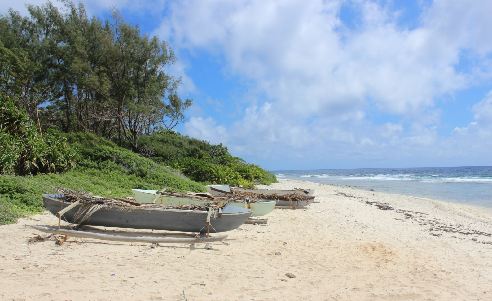
Te va'a tumu tautai nō Rimatara – Jérôme Petit