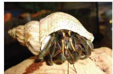
Coenobita cavipes • u'a • Bernard l'hermite