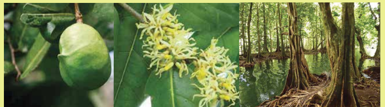
Inocarpus fagifer • mape • châtaignier tahitien