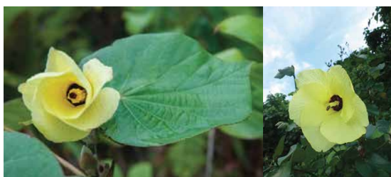
Hibiscus tiliaceus • pūrau, fau • hibiscus des plages Critères d'identification : feuille en cœur, duveteuse (poils) et mat, avec la tige de la feuille (pétiole) qui s'insère au bord de la feuille (limbe)