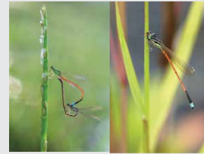
Ishnura aurora Agrion de l'aurore

Libellules : Au repos les ailes sont sur les côtés. Beaucoup plus grosse que les demoiselles.