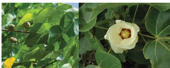
Thespesia populnea • miro, 'amae • bois de rose d'Océanie Critères d'identification : feuille en cœur lisse et brillante, avec la tige de la feuille (pétiole) qui s'insère au bord de la feuille (limbe)

Critères d'identification : fleur en pompon, gros fruit