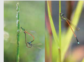
Ishnura aurora Agrion de l'aurore

Libellules : Au repos les ailes sont sur les côtés. Beaucoup plus grosse que les demoiselles.