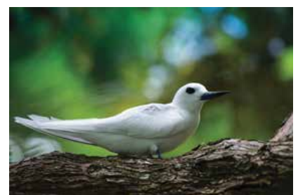
Gygis alba • gigis blanche