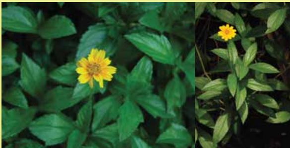
Sphagneticola trilobata • wedelia à fleurs jaunes