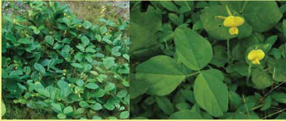
Vigna marina • pipi tatahi • pois de bord de mer