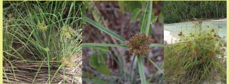
Cyperus javanicus • mou'u ha'ari • roseau d'eau, mariscus