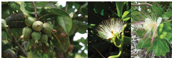
Barringtonia asiatica • hotu, hutu • bonnet d'évêque

Critères d'identification : fleur en pompon, gros fruit