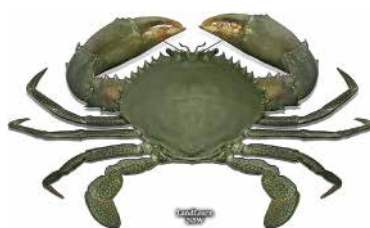
Scylla serrata • upai, paapaa • crabe des palétuviers ou crabe vert