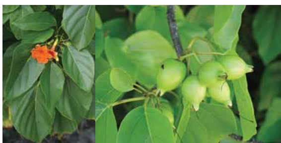
Cordia subcordata • tou • noyer d'Océanie ou faux-ébène

Critères d'identification : herbe rampante (stolon)