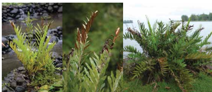
Acrostichum aureum • pihā'ato, 'aoa • fougère dorée