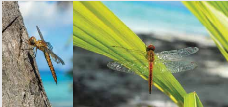
Pantala flavescens Libellule globe

Libellules : Au repos les ailes sont sur les côtés. Beaucoup plus grosse que les demoiselles.