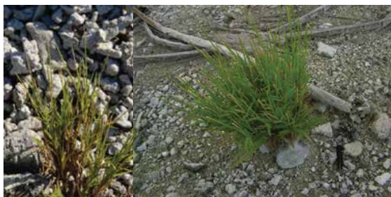
Lepturus repens • matie nanamu • lepture rampant