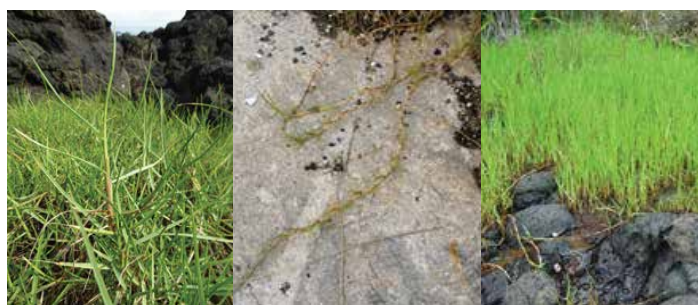
Paspalum vaginatum • matie tātahi • paspalum de bord de mer, chiendent de bord de mer

Critères d'identification : herbe rampante (stolon)