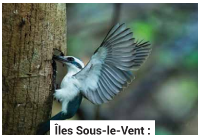
Îles Sous-le-Vent :