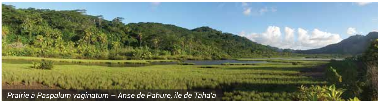
Prairie à Paspalum vaginatum – Anse de Pahure, île de Taha'a

Prairie à Paspalum vaginatum : Cette formation littorale ou marécageuse herbacée se compose essentiellement de l'herbe indigène Paspalum vaginatum en tapis denses ou en touffes éparses, parfois trouvée en association avec la fougère Acrostichum aureum . Cette formation est en régression en raison de l'urbanisation littorale et est progressivement remplacée par la mangrove à Rhizophora stylosa .