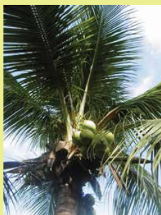
Cocos nucifera • ha'ari, niu, • cocotier