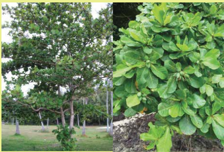
Terminalia catappa • 'autera'a popa'ā • badamier