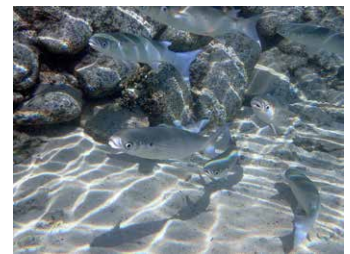
Crenimugil crenilabis • aua (petit), 'orie (juvénile), patehu (sub-adulte), tehu (adulte) • mullet boxeur