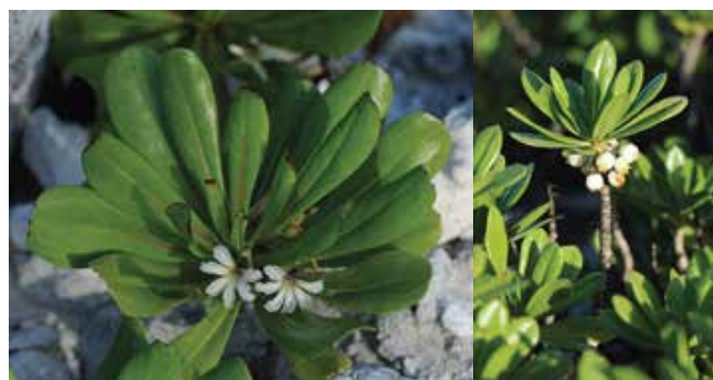
Scaevola taccada • 'āpata • veloutier vert