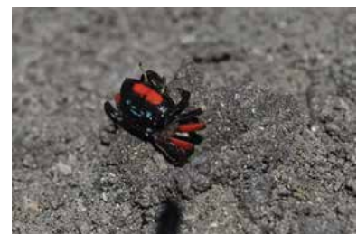
Uca pugilator • crabe violoniste