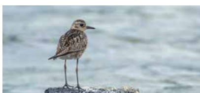
Pluvialis fulva • torea • pluvier fauve