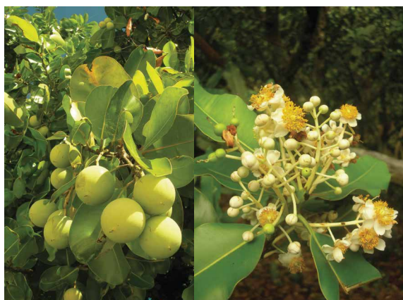
Calophyllum inophyllum • tamanu, 'ati • laurier d'Alexandrie