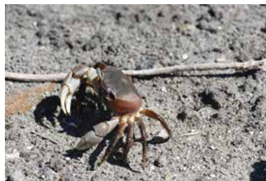
Cardisoma carnifex • tupa • crabe de terre brun