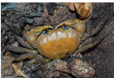
Tuerkayana rotundum • crabe de terre rugueux