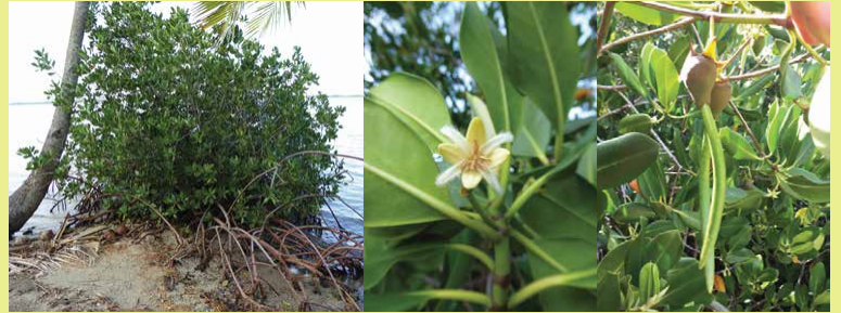
Rhizophora stylosa • palétuvier rouge • Fleur du Palétuvier • Fruit du palétuvier