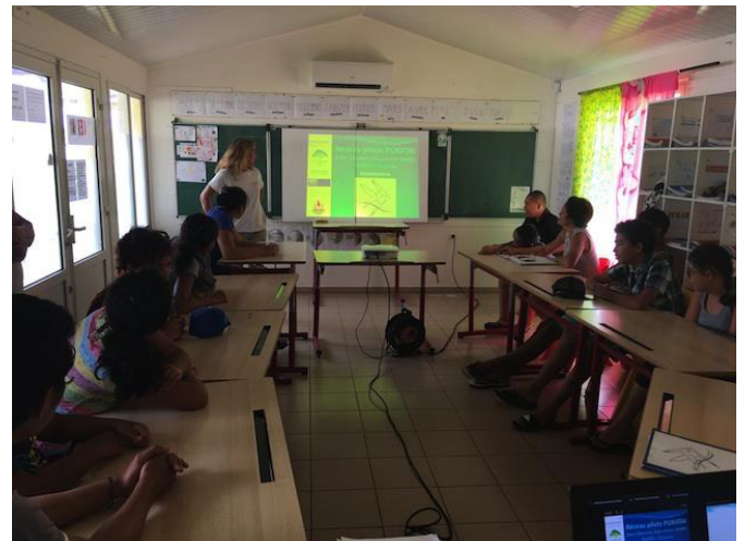
Présentation en classe à l'IIME de Taravao