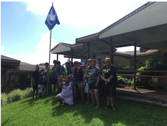
Groupes d'élèves de l'IIME de Taravao