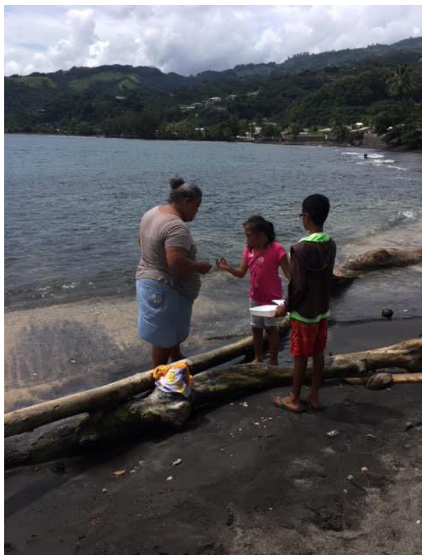
Activité de reconnaissance des invertébrés au tombeau du roi (AME de l'IIME de Pirae)

Fédération des Associations de Protection de l'environnement - TE ORA NAHO