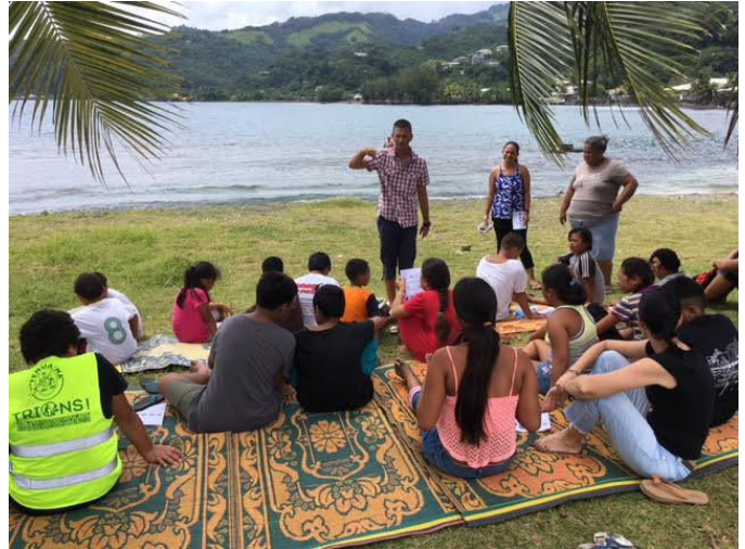
Consignes pour une activité sur les invertébrés au tombeau du roi (AME de l'IIME de Pirae)