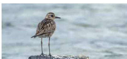
Pluvialis fulva • torea • pluvier fauve