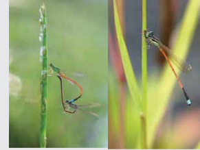
Ishnura aurora Agrion de l'aurore

Libellules : Au repos les ailes sont sur les côtés. Beaucoup plus grosse que les demoiselles.