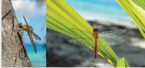
Pantala flavescens Libellule globe

Libellules : Au repos les ailes sont sur les côtés. Beaucoup plus grosse que les demoiselles.